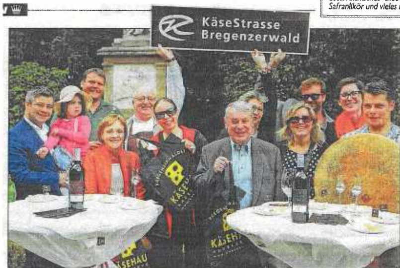
Sichtlich geschmeckt hat es unseren Gewinnern des „Krone“-Muttertagsgewinnspiels auf dem Genussfestival. Die 20 Damen und Herren konnten am Vorarlbergstand die

herzhaftesten Spezialitäten aus dem „Ländle“ verkosten. Überdies war das Kulinarik-Fest wieder ein voller Erfolg. Zehntausende Besucher ließen es sich im Stadtpark gutgehen.