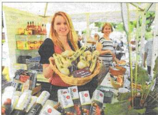
Eine Insel der Genüsse ist der Stadtpark bis einschließlich Sonntag. Handgebeizte Saibling, Ziegenamernbert und Himbeersturm, Hirschbratwürste, Pinzgauer Bierkäse, oberösterreichisches Biobauernbrot, Wachauer Safranlikör und vieles mehr – erneut sind die

feinsten Delikatessen und Raritäten zum Verkosten und Einkaufen aufgetischt. An 160 Ständen können sich die Besucher direkt bei den Produzenten über Herstellung und Inhalt der kulinarischen Köstlichkeiten informieren. Eintritt frei. Info: www.genuss-festival.at