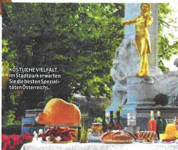
KÖSTLICHE VIELFALT. Im Stadtpark erwarten Sie die besten Spezialitäten Österreichs.

SEDLNITZKY: Im und rund ums Bio-Zelt wird für Familien und Kinder immer etwas vorbereitet, dieses sollten Sie also unbedingt besuchen!